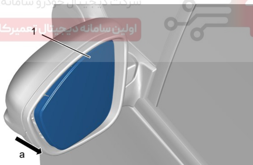
شکل : C4CG0N0D

اولین سامانه دیجیتال تعمیرکاران خودرو در ایران