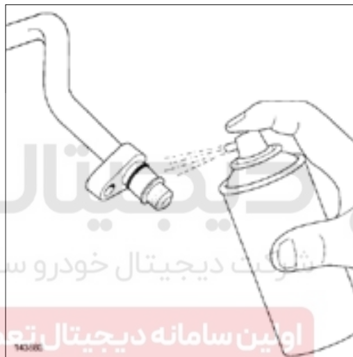
سطح و واشرهای لوله‌های اتصال را با استفاده از ماده ENGINE CLEANER تمیز کنید (به خودروهایی که قطعات و مواد مصرفی برای تعمیرات رجوع کنید).