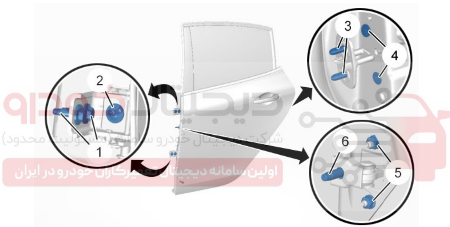
Figure : C4CB02QD